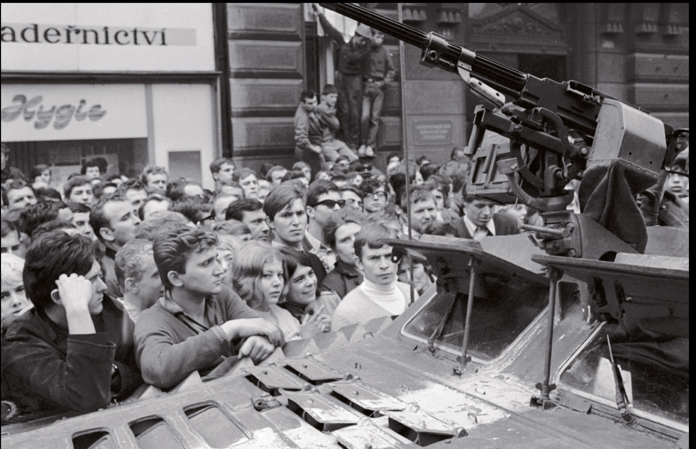
Ústí nad Labem