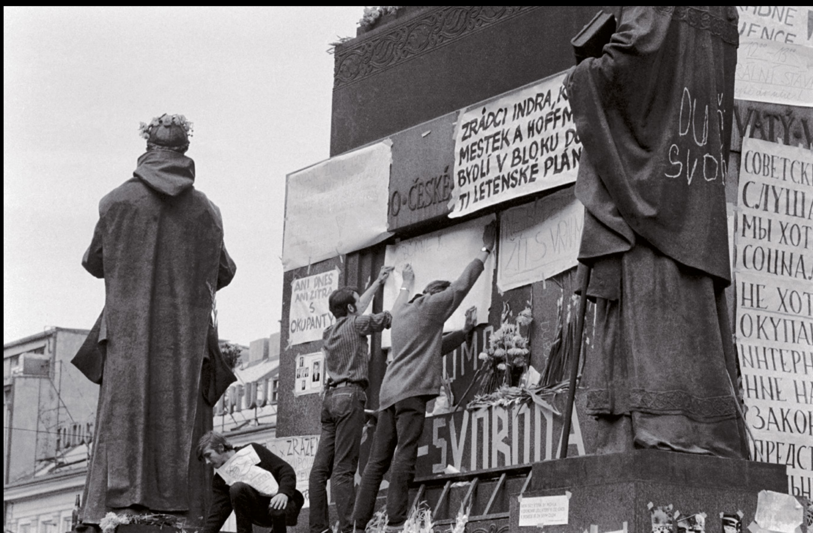
Praha

Pomník sv. Václava v Praze pokrytý protiokupačními nápisy. Obdobně jako v jiných historických okamžicích 20. století se i v srpnu 1968 stal místem, kde se scházeli lidé protestující proti bezpráví.