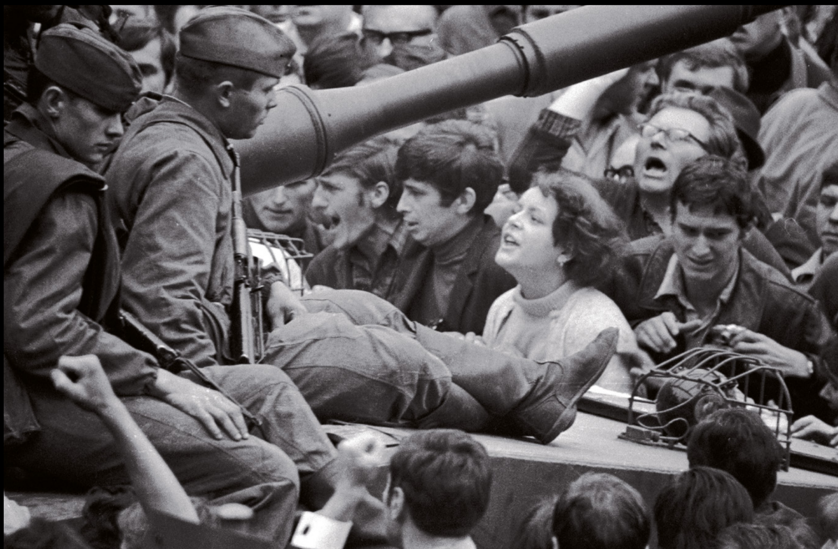
Praha

Do Československa přijelo okolo 6 300 invazních tanků, které se v prvních dnech srpnové okupace objevily v centru většiny měst. Brzy je následovalo asi 750 000 vojáků. Po listopadu 1968 zůstala na našem území už pouze sovětská armáda v odhadovaném počtu okolo 150 tisíc osob zhruba v třiatřiceti lokalitách.