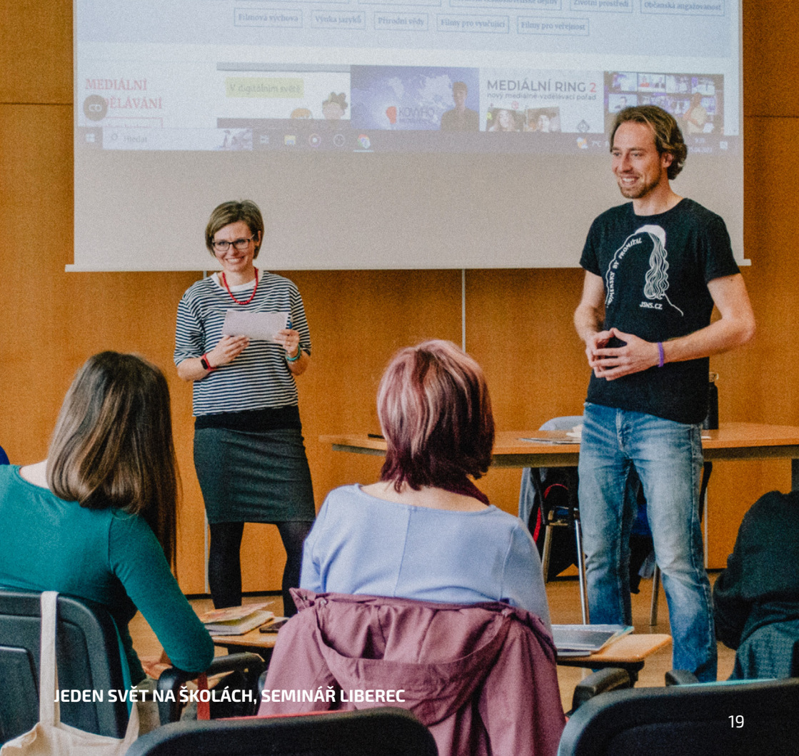
JEDEN SVĚT NA ŠKOLÁCH, SEMINÁŘ LIBEREC