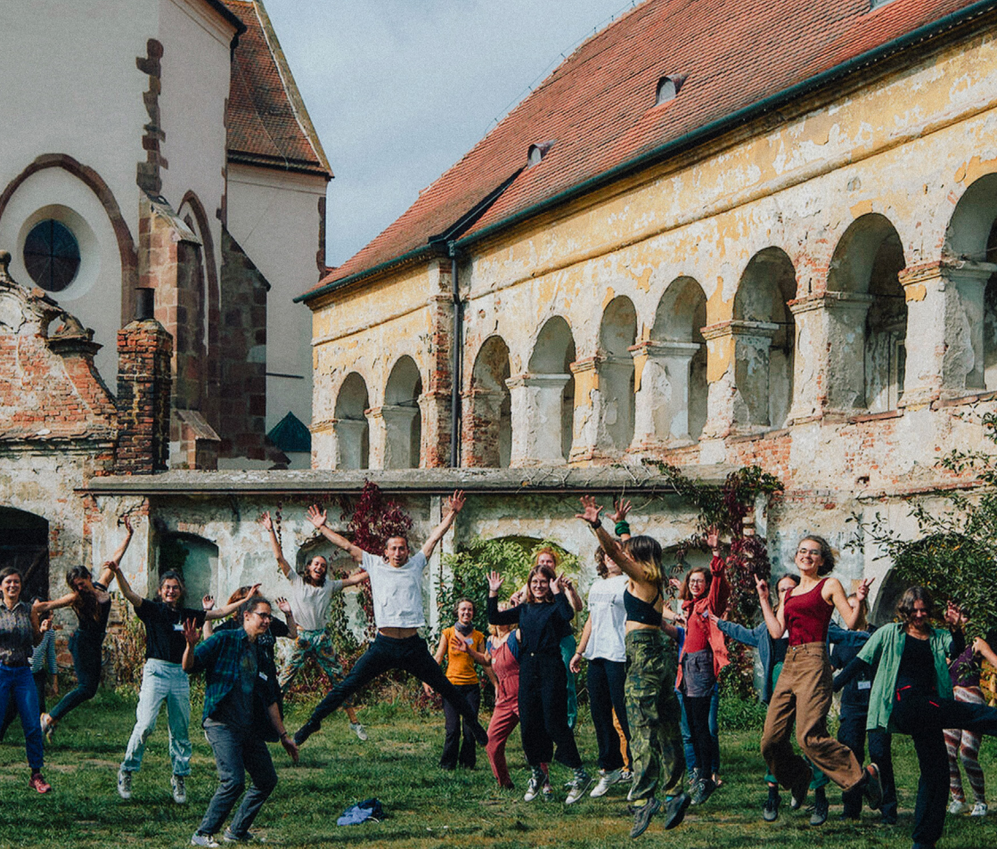
NAZEMI, GENERACE SYMBIOCEN