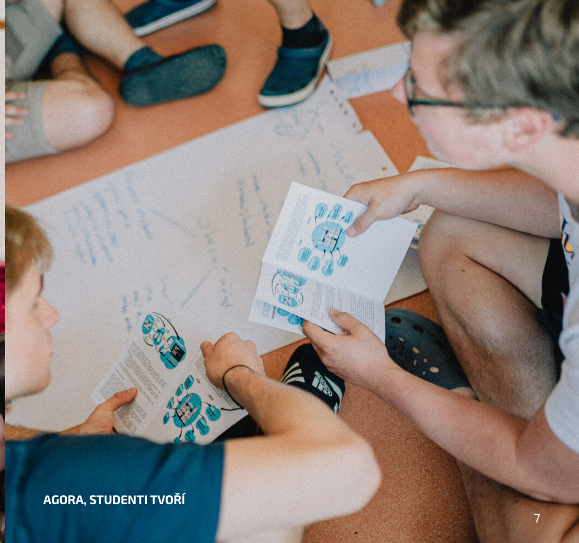
AGORA, STUDENTI TVOŘÍ