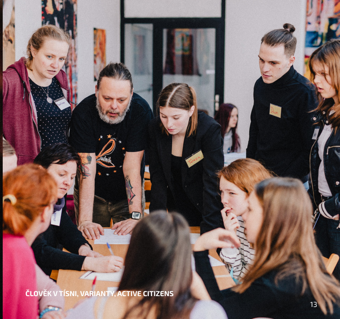
ČLOVĚK V TÍSNĚ, VARIANTY, ACTIVE CITIZENS