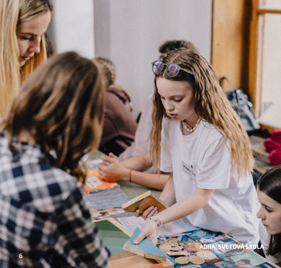
ADRA, SVĚTOVÁ ŠKOLA