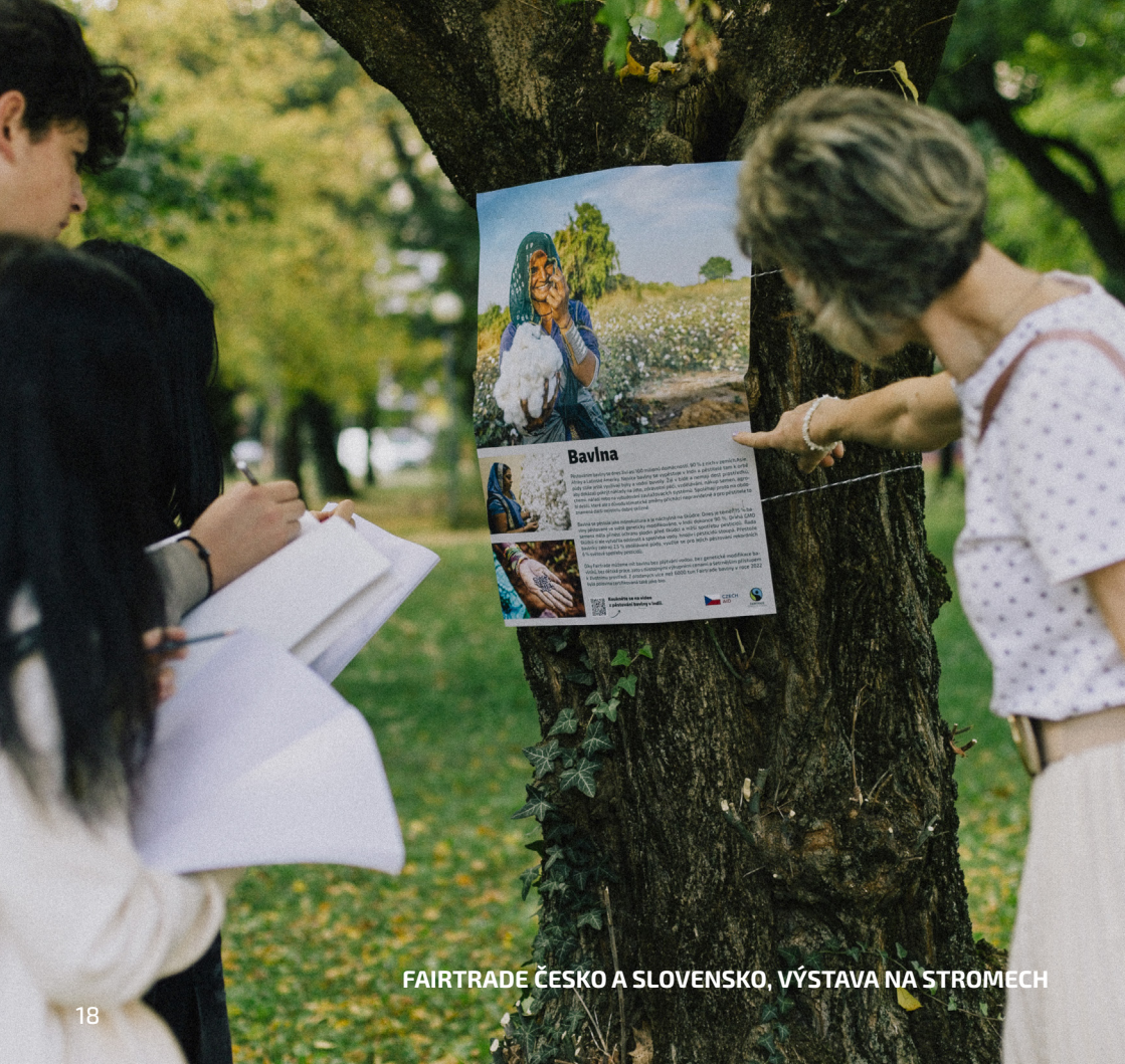
FAIRTRADE ČESKO A SLOVENSKO, VÝSTAVA NA STROMECH