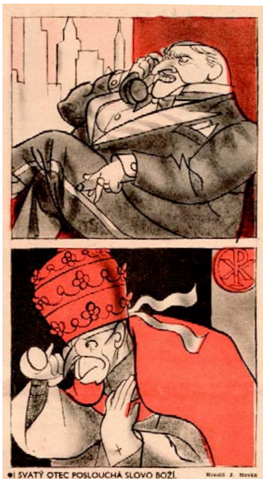
● SVATÝ OTEC POSLOUCHÁ SLOVO BOŽÍ.