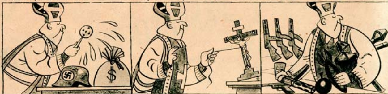
- CO JE SVATÉ

NEBEZPEČÍ EXKOMUNIKACE! VARUJEME STATISICE ČTENÁŘŮ, KTEŘÍ SI PRAVĚ ZAKOUPILI NÁŠ LIST: PŘESKOČTE IHED TUTO STRÁNKU! PROČ? Pst, důvěrně: 3. května t.r. varoval vatikánský rozhlas své posluchače před našim listem. „a že prý DIKOBRAZ zesměšuje vše-