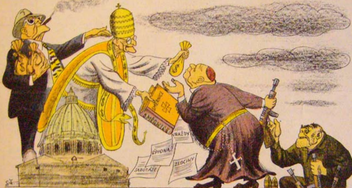
K nedávnému procesu s agenty Vatikánu v Brně.