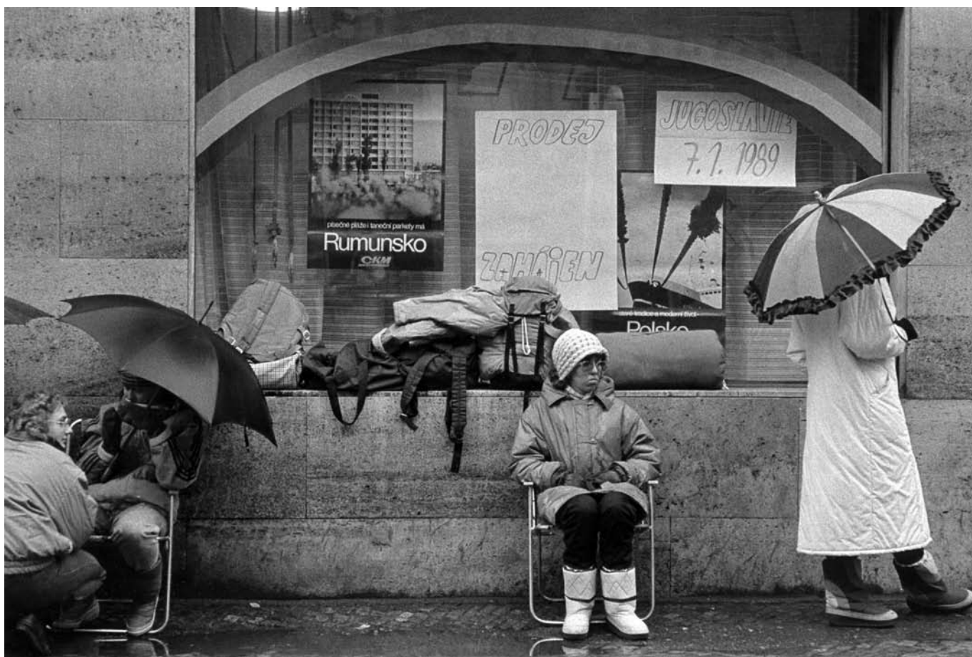
Karel Cudlín: Čekání na zájezd před Cestovní kanceláří mládeže. Praha, 1989