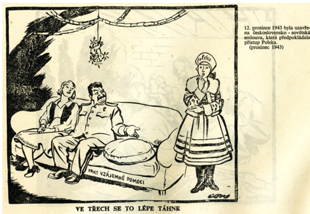
LOW, David. Válka začala Mnichovem. Londýn: Nová Evropa, 1945. 62 s.